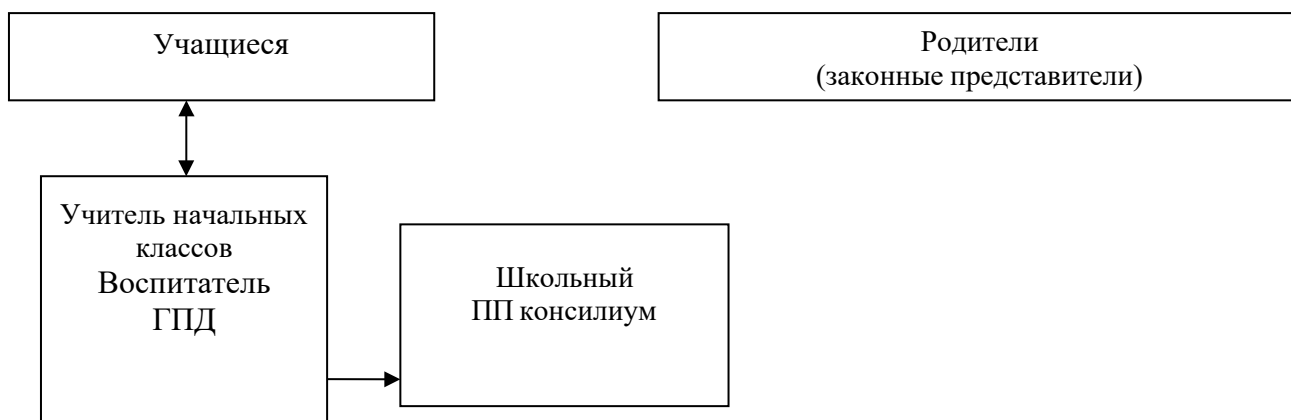
Рисунок 1. Модель взаимодействия педагогов и специалистов

Особое место в модели взаимодействия педагогов и специалистов общеобразовательного учреждения занимают родители (законные представители) учащихся с умственной отсталостью (интеллектуальными нарушениями) в решении вопросов их развития, социализации, здоровьесбережения, социальной адаптации и интеграции в общество.